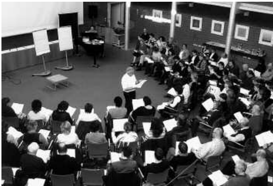
Die Aula des Wilhelm-Kempf-Hauses war wieder gut gefüllt mit Teilnehmerinnen und Teilnehmern aus dem Hessenland.

spielsweise afrikanische Lieder auf einfachste rhythmische Strukturen zu reduzieren und mit diatonischer Harmonik zu befrachten, sei dahingestellt.